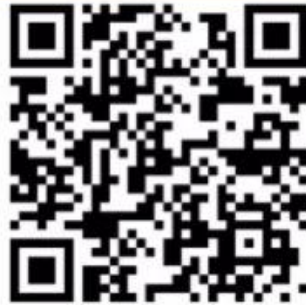
老人心灵呵护服务网络加入申请表

(3) 打印《老人心灵呵护服务网络加入申请表》并签字，进行扫描或拍照； (4) 通过微信识别二维码（见下图）填写相关信息。上传扫描图片或者拍照。